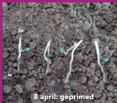
8 april: geprimed