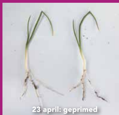
23 april: geprimed