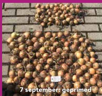
7 september: geprimed