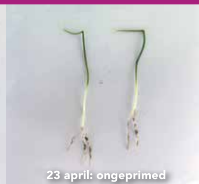
23 april: ongeprimed