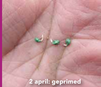
2 april: geprimed