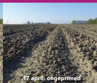
17 april: ongeprimed