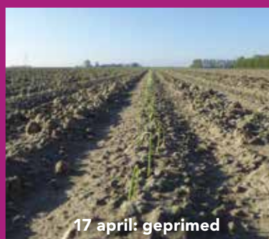
17 april: geprimed