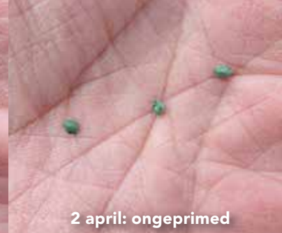
2 april: ongeprimed