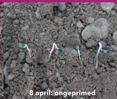
8 april: ongeprimed