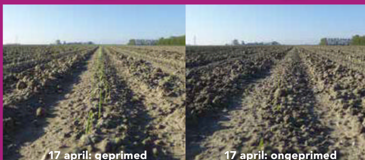
17 april: geprimed