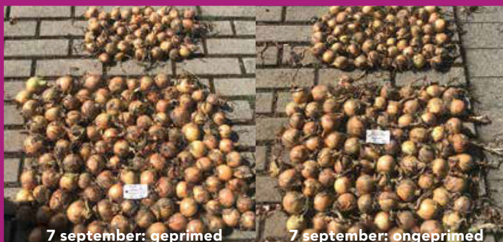
7 september: geprimed