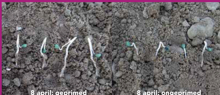
8 april: geprimed