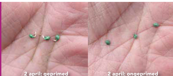
2 april: geprimed